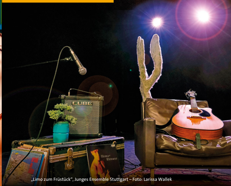
„Limo zum Frühstück“, Junges Ensemble Stuttgart